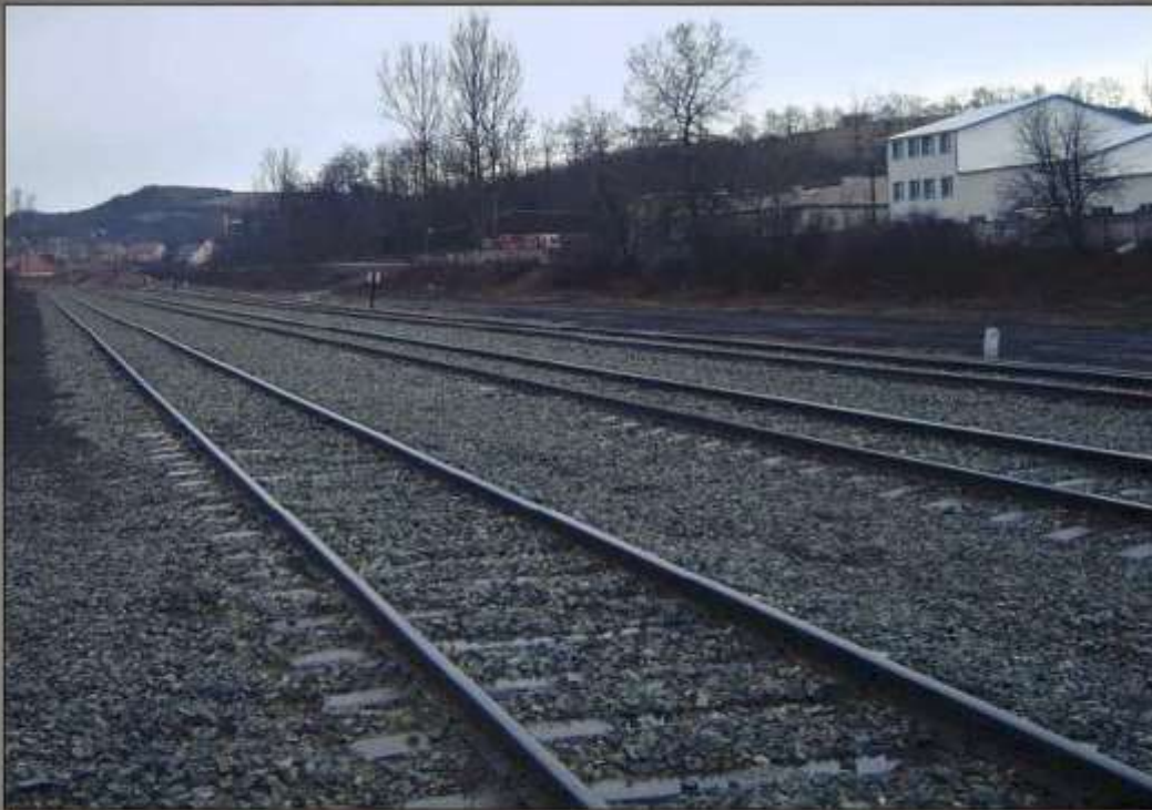
Vasúti rakodó (Rudabánya).