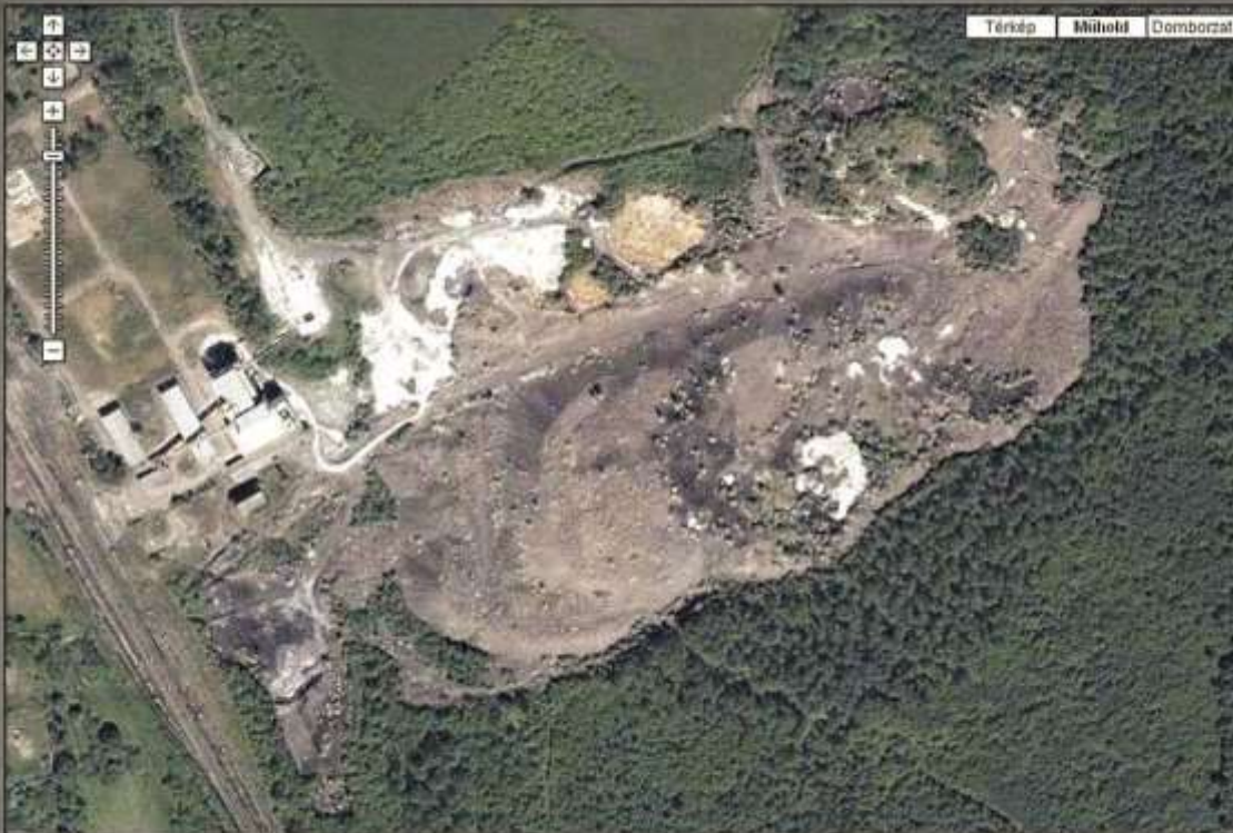
Műholdkép az ércdúsító meddőhányóról és a Rudagipsz-Mix telephelyről.