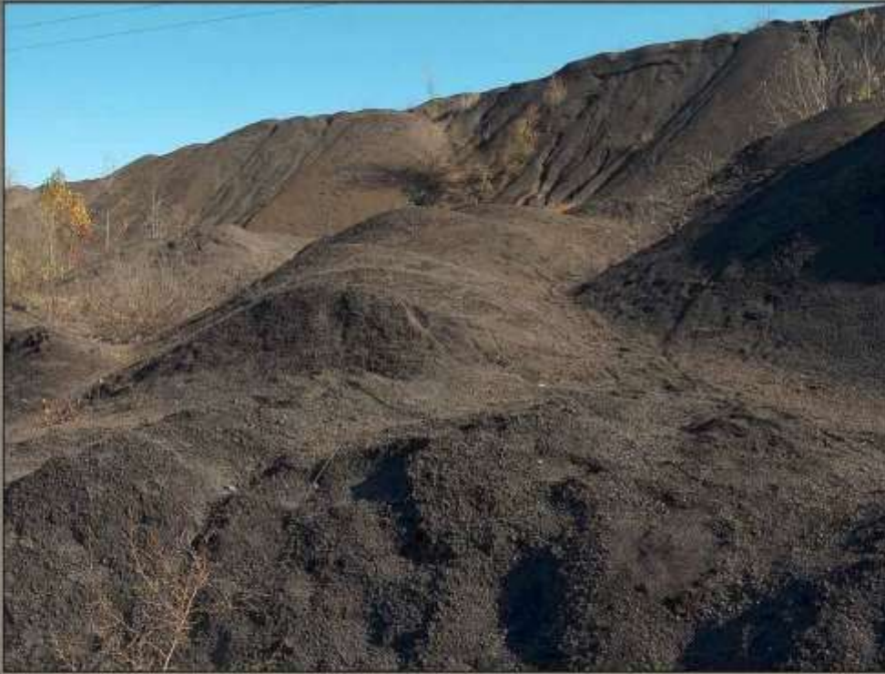
Egykori vasércdúsító meddőhányója. Másodlagos nyersanyag forrás.